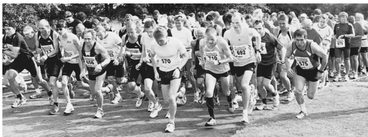
Beim Start schien noch die Sonne: 133 Läuferinnen und Läufer nahmen in Salzkotten den 10-Kilometer-Lauf in Angriff. Ab Kilometer drei gab's dabei eine unliebsame Abkühlung. Ein heftiger Gewitterschauer durchnässte die Starter.

Fußball: Remis für Bleiwäsche Im dritten Saisonspiel gab's für den Briloner B-Ligisten TuS Madfeld/Bleiwäsche das erste Remis: Das Heimspiel gegen die SG Rösenbeck/Nehden endete 2:2. Der TuS hat nun vier Punkte auf dem Konto und gastiert am kommenden Sonntag um 15 Uhr im Derby beim BV 23 Alme.