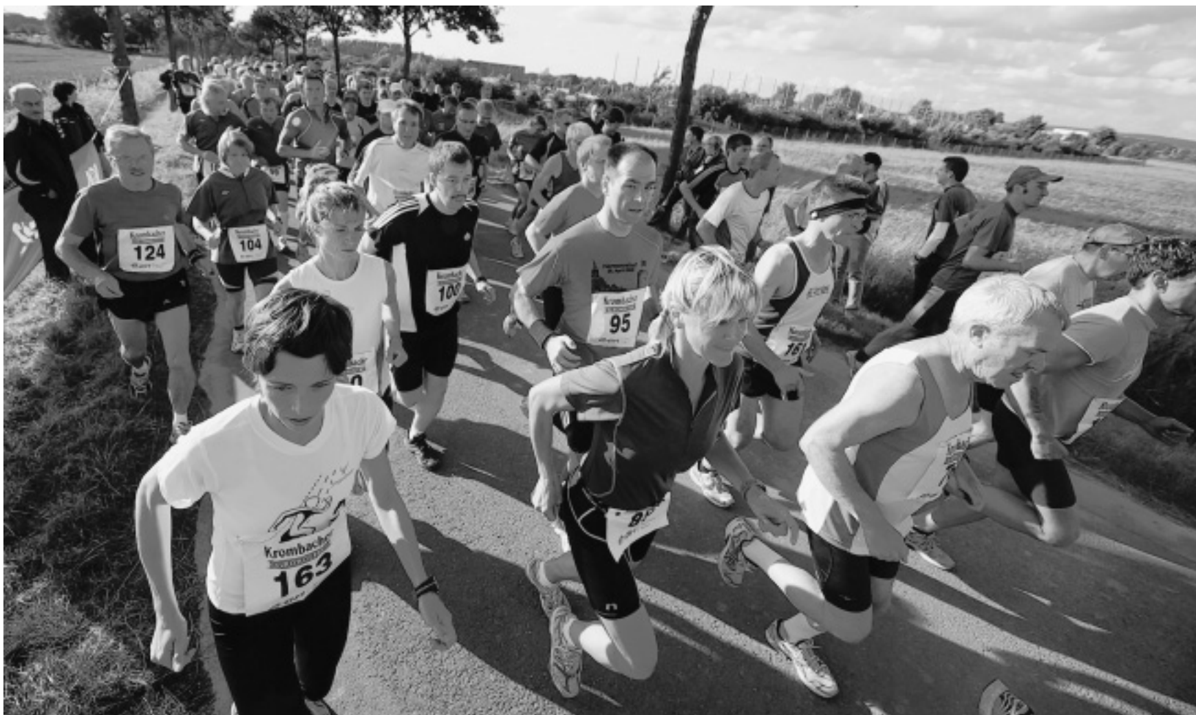
Los geht's: Bei gutem Laufwetter startete beim 11. Marienloher Volkslauf eine stattliche Zahl über die 10-Kilometer-Distanz.